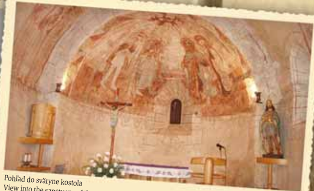
Pohľad do svätyne kostola View into the sanctuary of the church