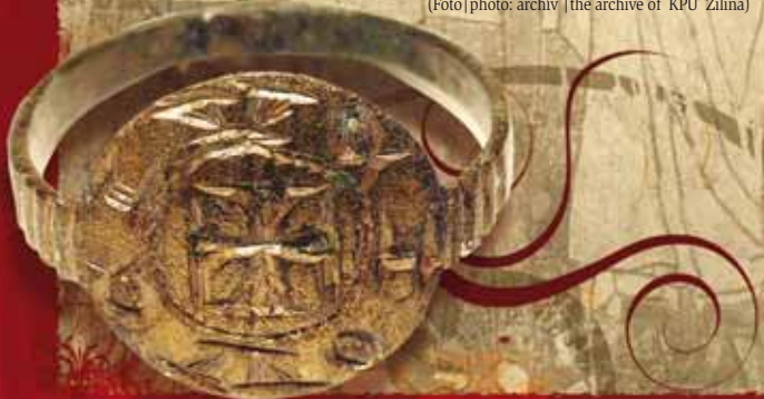
Bronzový prsteň s latinským textom Bronze ring with Latin inscription

Kostol je ohradený kamenným múrom so vstupnou bránou a kruhovou baštou. V súčasnosti je prístupný verejnosti počas bohoslužieb alebo na objednávku. The church is enclosed by a stone wall with an entrance gate and a circular bastion. Nowadays the church is open during public worship or by request.