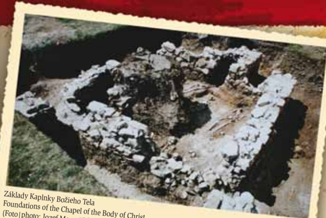
Základy Kaplnky Božieho Tela Foundations of the Chapel of the Body of Christ

Románsky vzhľad kostola pretrval bez väčších stavebných zmien až do roku 1762. V tomto období sa uskutočnila baroková prestavba, ktorá výrazne zmenila vzhľad kostola. Zmieňuje sa o tom chronostikon, umiestnený na víťaznom oblúku medzi svätyňou a loďou kostola. Odvtedy až do posledného archeologického výskumu v roku 1995 a 2000 sa mylne predpokladalo, že kostol pozostával z dvoch častí. Viacerí sa domnievali, že oltárna časť (svätyňa) je staršia ako loď. Archeologický výskum to však nepotvrdil. Celá stavba vznikla v jednom období. Zmenil sa však vstup do kostola z pôvodnej južnej strany na západnú. Pôvodný rovný strop nahradila baroková klenba a románske okienka zamurované pod dnešnou strechou nahradili veľké barokové okná.