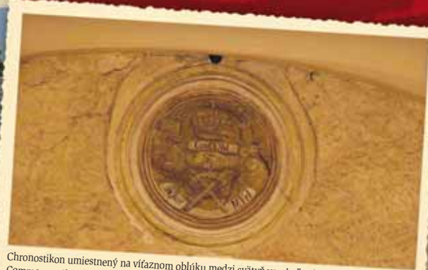
Chronostikon umiestnený na vífáznom oblúku medzi svätyniou a loďou kostola Commemorative date inscription to be found on the triumphal arch between the sanctuary and the nave of the church

V areáli kostola, južne od jeho svätyně, bola objavená Kaplnka Božieho Tela z konca 14. a začiatku 15. storočia. Slúžila ako kostnica do polovice 16. storočia. Okolo nej sa našlo 80 kostrových hrobov, ktoré sú datované od konca 12. do konca 19. storočia. Viaceré z nich boli priamo pod základmi stavby v jej priestore, ale i z vonkajšej strany základov. V najstaršom hrobe bola pochovaná žena. Pri jednom z hrobov sa našiel unikátny bronzový prsteň s latinským textom zloženým zo siedmich písmen I - O - A - C - I - V - E, ktorých tvar zodpovedá obdobiu 12. - 13. storočia. Nápis by mohol znamenať skratku Ioannes cives, čo v preklade znamená „občan Ján“. V hroboch sa našlo viacero mincí. Najstaršou je minca Karola Róberta z roku 1338. Našla sa tu i minca Eudovíta I. (1372 - 1382), poškodená minca Ferdinanda II. a štyri medené mince Františka Jozefa I. Najmladšia nájdená minca pochádza z roku 1899.