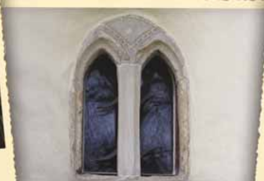
Ranogotické okno znievského typu Early Gothic window in „znievsky“ style