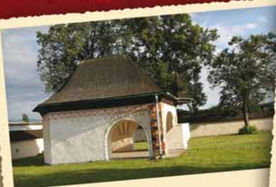
Kaplnka Božieho Tela Chapel of the Body of Christ